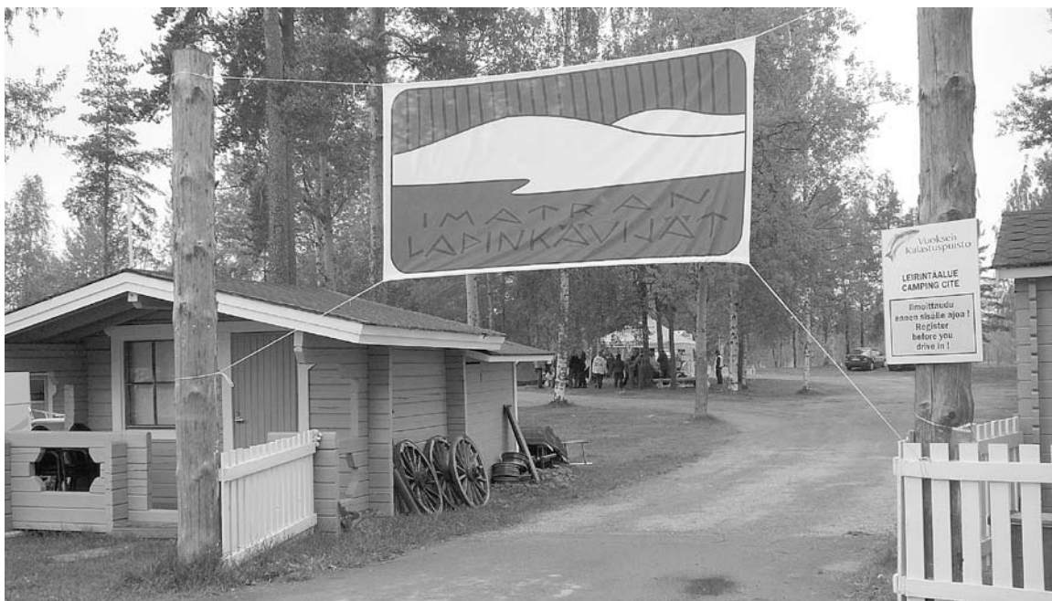
Banderolli on viritetty jo monien puiden ja pylväiden väliin kertomaan, mikä porukka on asialla. Tässä banderollin ensiesiintymisen Varpasaassa toukokuussa 2011.

Yhdistyksen 50-vuotisjuhlia vietettiin railakkaasti Imatran teatterin Housut pois-näytelmän merkeissä. Meno oli sen mukaista, että ensimmäiset juhlijat poistuivat jo puheiden jälkeen ennen teatteriesityksen alkua ja kato kävi vielä väliajalla. Näyttelijätkin ihmettelivät, että olipa hiljainen yleisö. Ainakin me järjestäjät muistamme juhlan, emmehän voineet edellisenä talvena varausta tehdessämme tietää, mikä esitys syksyllä on. Ostimme siis sian säkissä. 60-vuotisjuhlissa onkin ihan kotikutoista ohjelmaa.