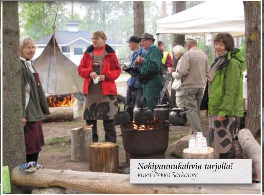
Nokipannukahvia tarjolla!