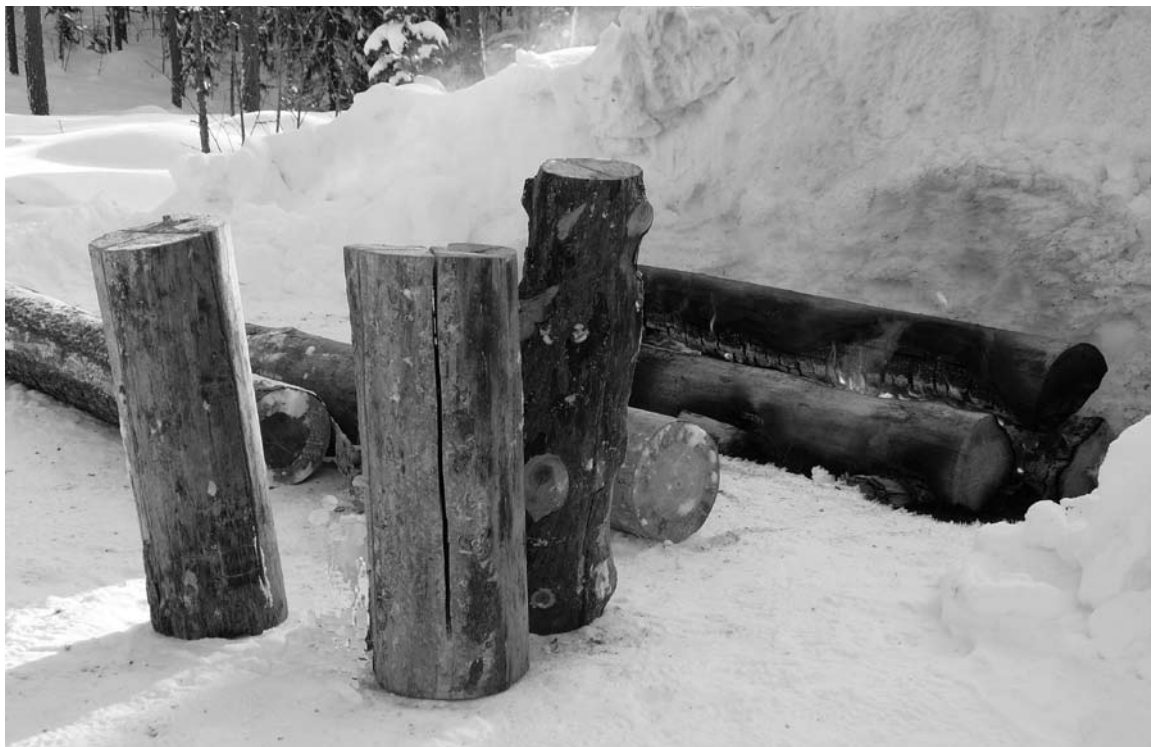
Rakotulilla tunnelmointi kuuluu Ollinmajan talvitapahtumiin.