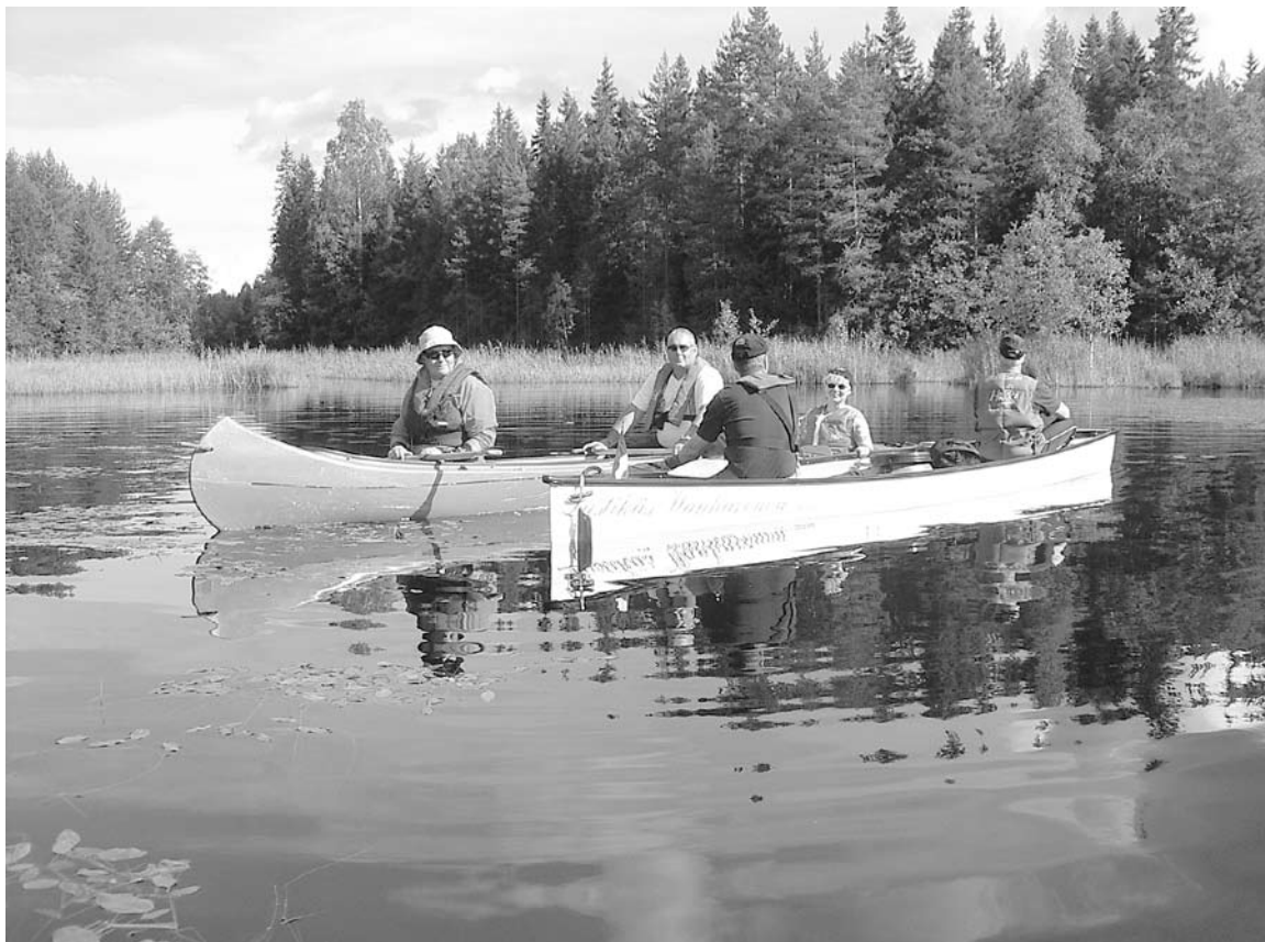
Inkkarimelajat tauolla Arabiankorven vesillä.