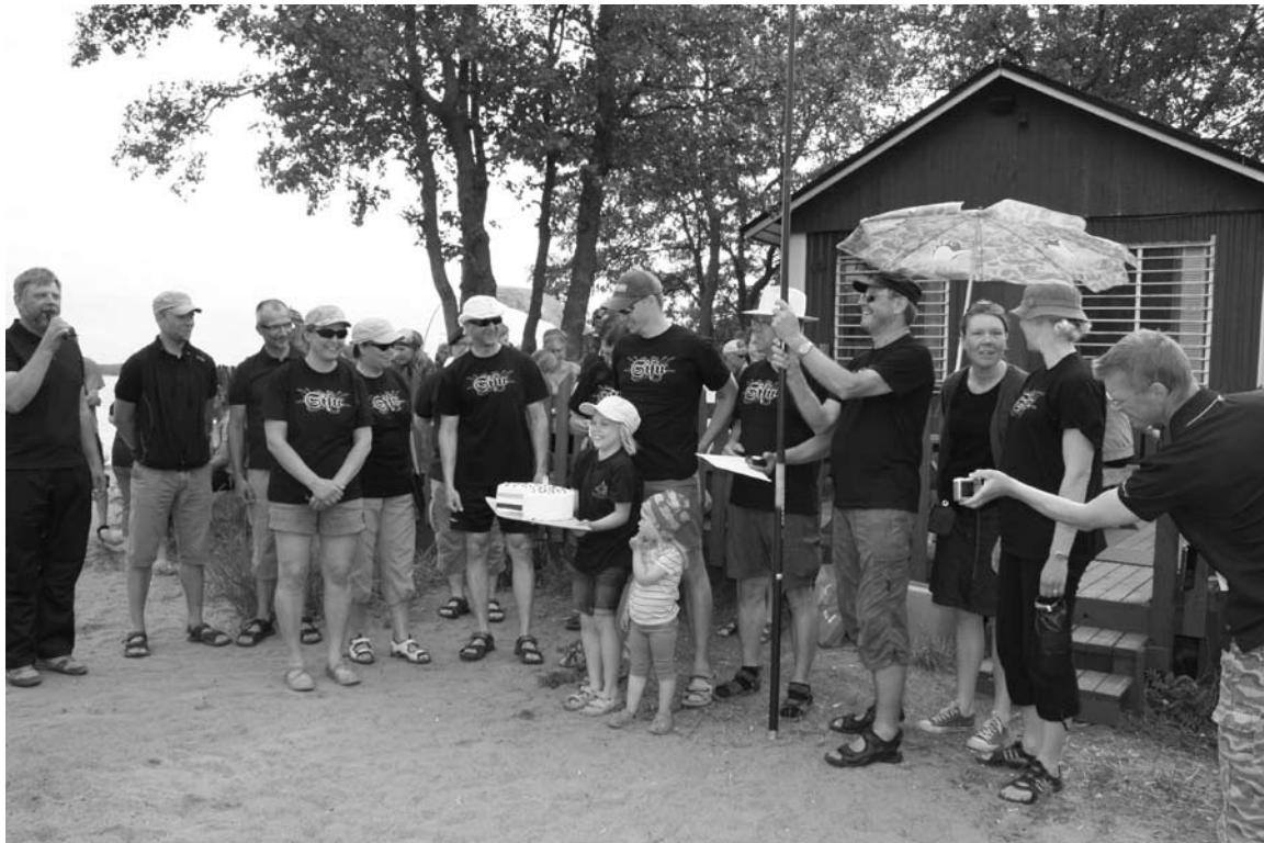
Sisutiimin juhlaa, eli voitto kotiin!