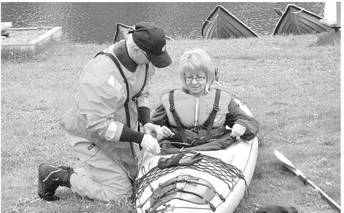
Melontaan tutustumista Varpasaaren kevättapahtumassa.