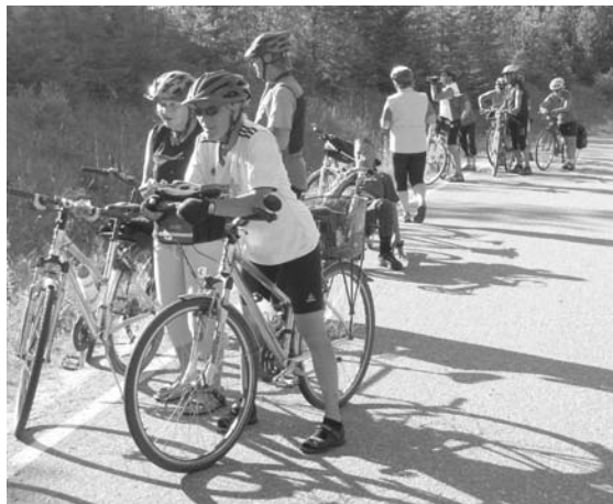
Jäppilänniemeen taidetiellä.