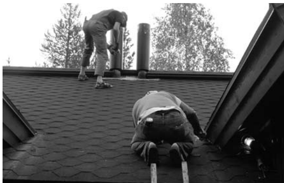
Kuvakulmaa katon korjaamiseen