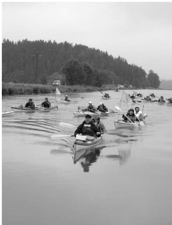
Suomi Meloo 2011. Kanootit halkovat tyylikkäästi tyyntä vedempintaa.

Vuosittain on järjestetty eri työyhteisöille TYKY – melontoja sekä peruskoululaisille melontaohjausta.