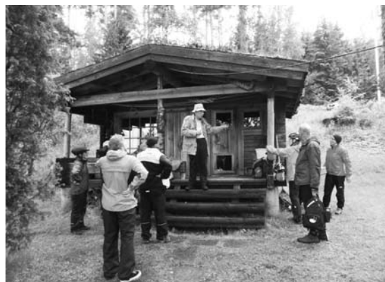
Makkaranpaistoretki Huhtasen kylään Karin luo.