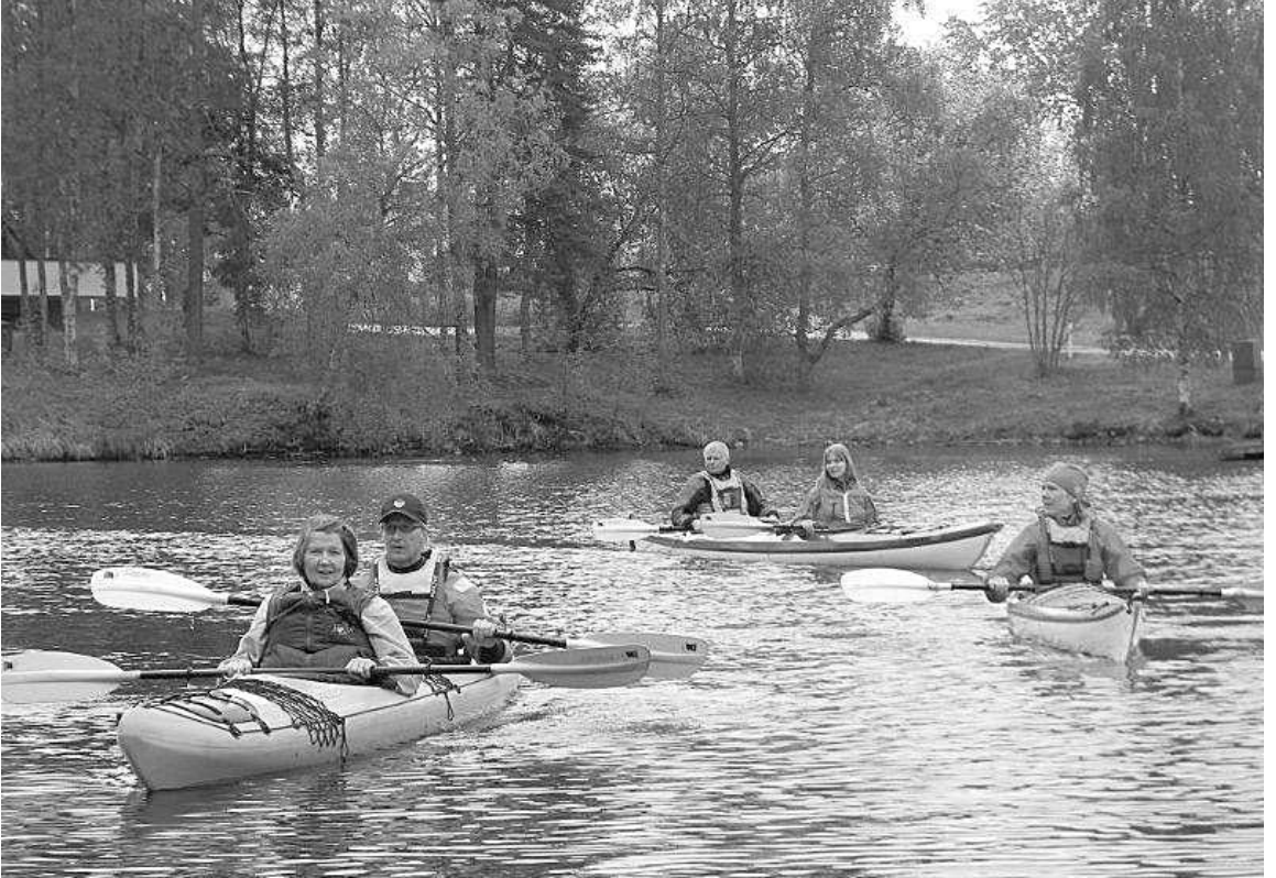
Ohjaajien kanssa vesillä Varpasaassa.