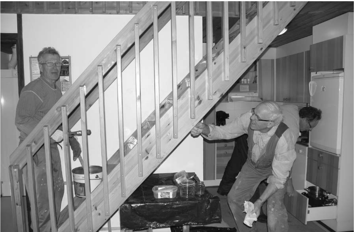
Saarihelyssä paikat kuntoon