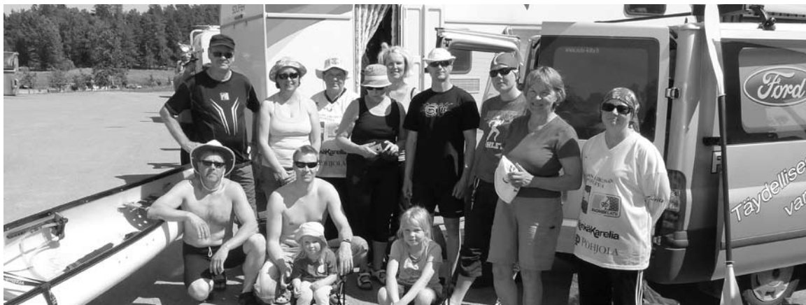
Joukkue hetken aikaa koolla Tuorlan maatalousoppilaitoksen pihalla