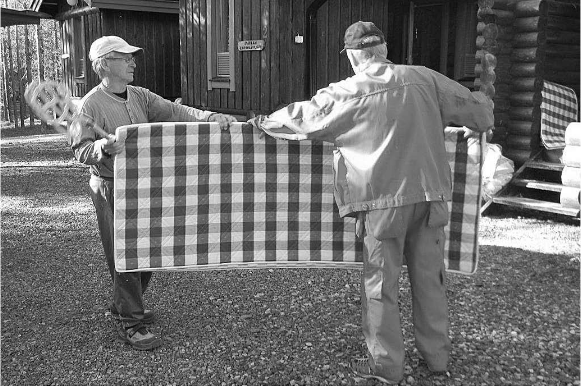
Sivouspäivä Ylläs – Jumpurassa