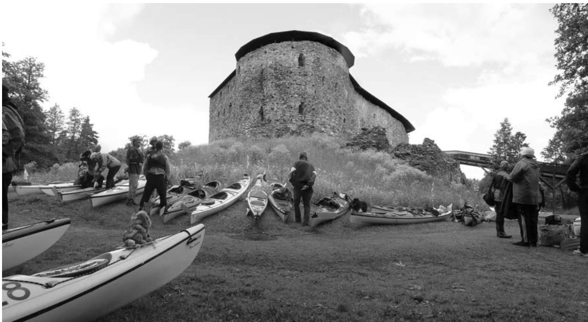
Vaihtopaikka Raaseporin linnan katveessa