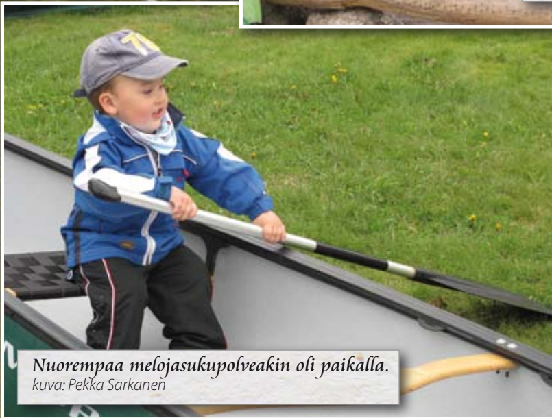
Nuorempaa melojasukupolveakin oli paikalla.