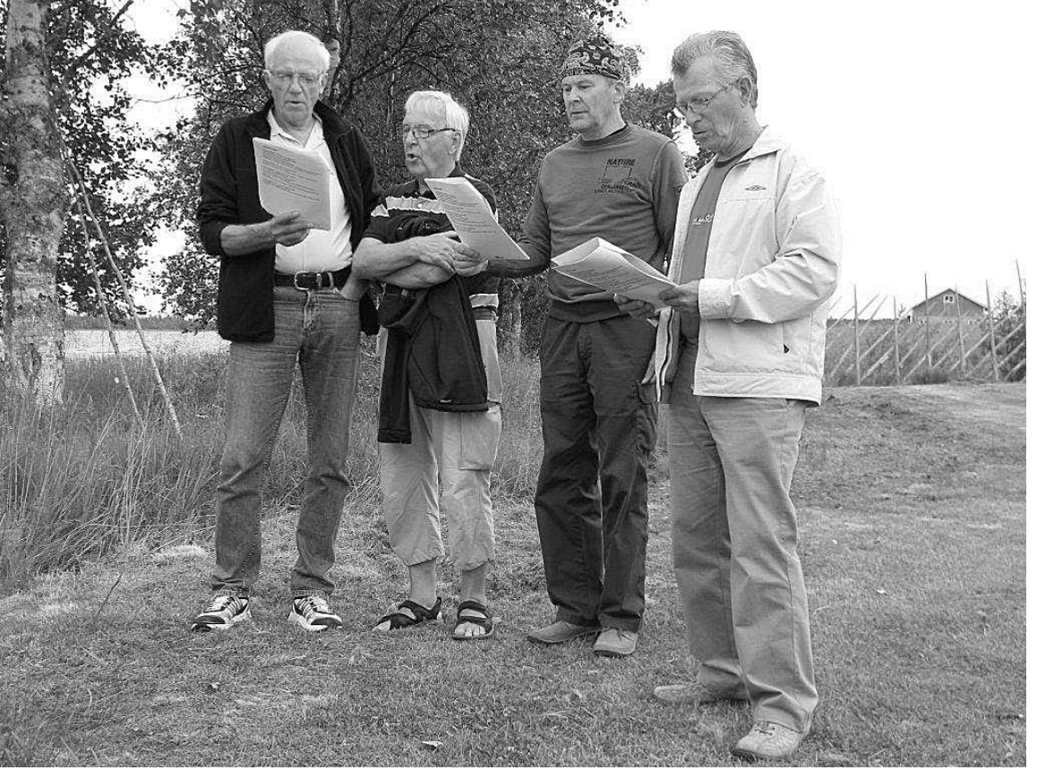
Lapinkävijöitten mieskvartetti lauluillan vietossa