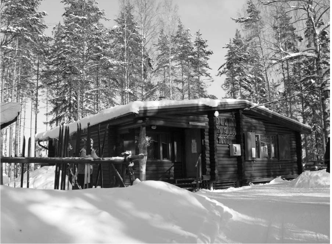
Ollinmaja talviasussaan sellaisena, kuin hiihtäjät sen näkevät, keitaana korven keskellä.

Heti, kun ensilumet ovat sataneet ja latukoneet ajaneet ladut Kurkisuon metsiin, alkaa Ollinmajan savupiipusta nousta savukiehkura. Luukut lähtevät ikkunoista ja puomi ovelta, ja majasta tulvii mehun ja munkkien tuoksu. Ollinmaja palvelee siinä perinteisessä tarkoituksessa, johon se 40 vuotta sitten on rakennettu, eli hiihtomajana. Toisille Ollinmaja on hiihtoretken pääetappi, toisille välimatkan krouvi. Toiset tulevat autolla Ollinmajalle ja hiihtävät sieltä lenkin. Oli miten oli, kaikki Vuoksen itäpuolen ladut johtavat Ollinmajalle.