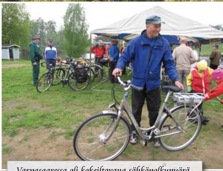
Varpasaassa oli kokeiltavana sähköpolkupyörä.