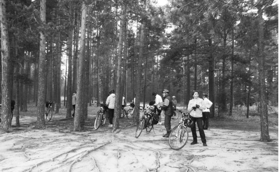
Uintirekellä Joutsenon Sappukanlahdella häiritsi viileä sää.