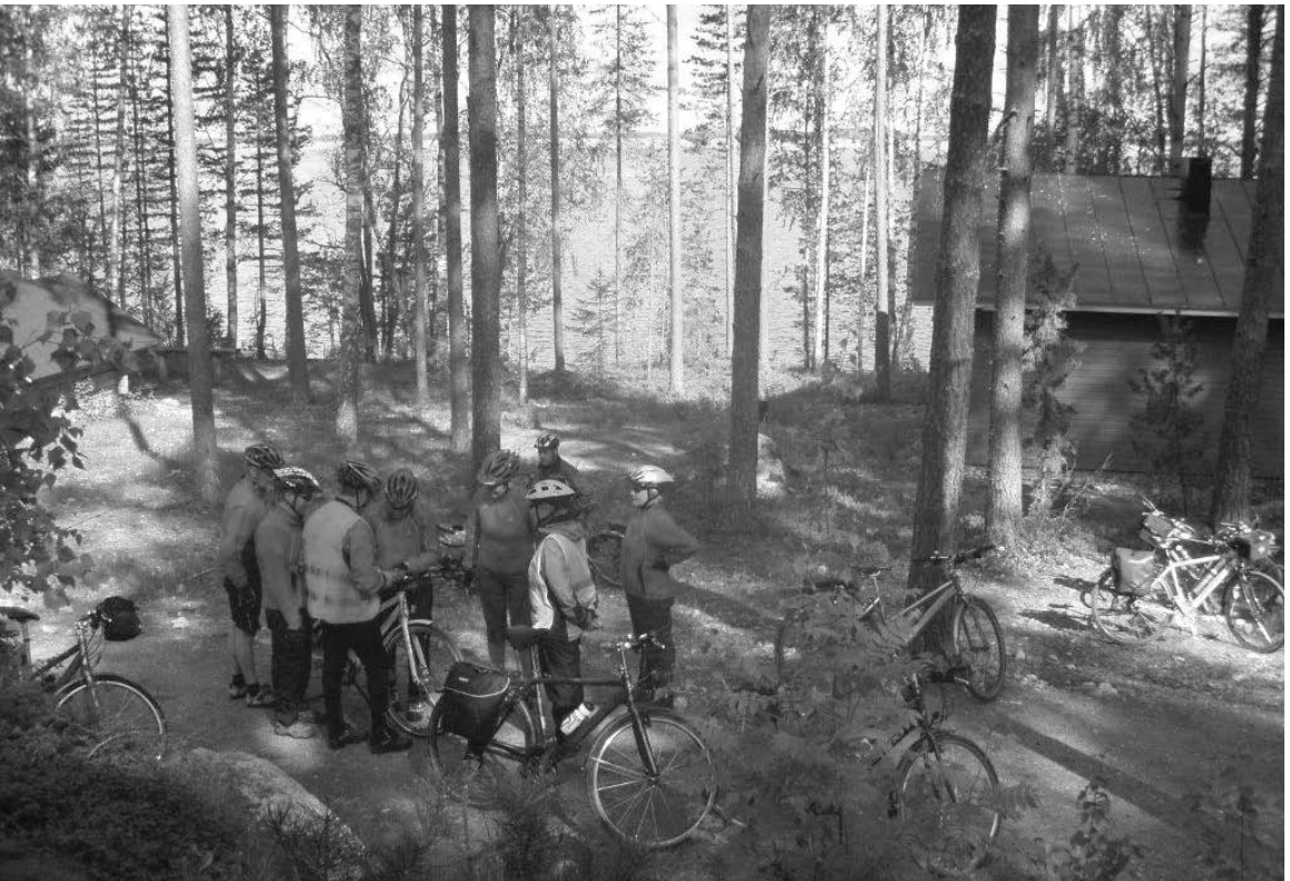
Varhaisaamu Taipalsaarella. Reijo pitää ajo – ohjepalaveria ennen 70 kilometrin pyöräilyä.