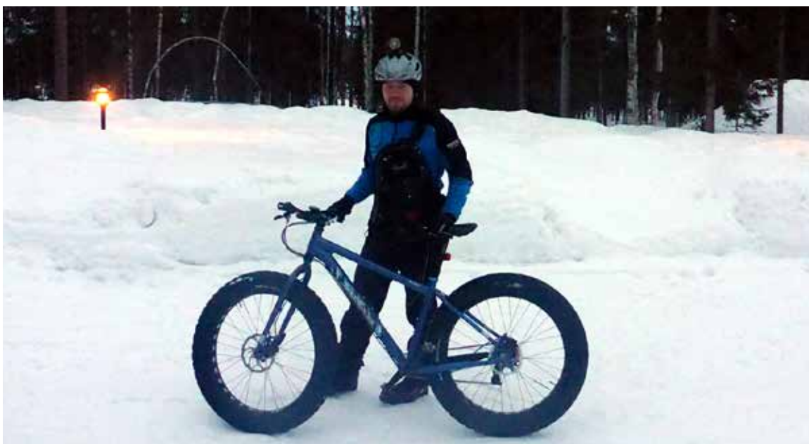
Minä ja Muhku.