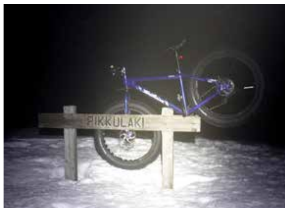
Yllästunturin pikkulaella.