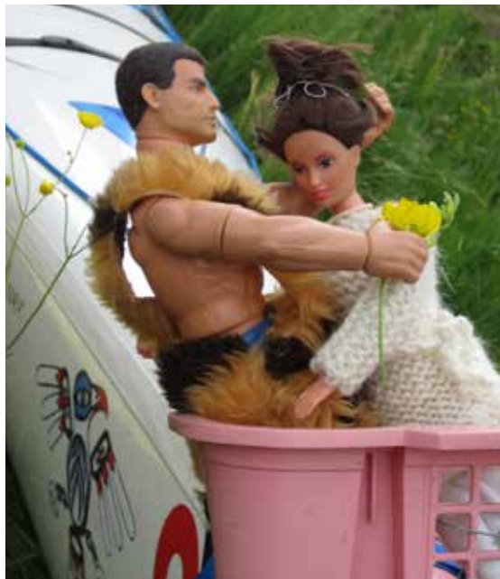
Maskottimme Villimies ja Antsku sulassa sovussa.

Taisi alun perin olla Tuijan idea, että Imatran ykkösjukkis, Antsku, olisi meille hyvä maskotti. Kun puolet joukostamme oli lappeenrantalaisia, pestattiin mukaan myös Villimies. Antskun valkoisen neuleen ja Villimie-