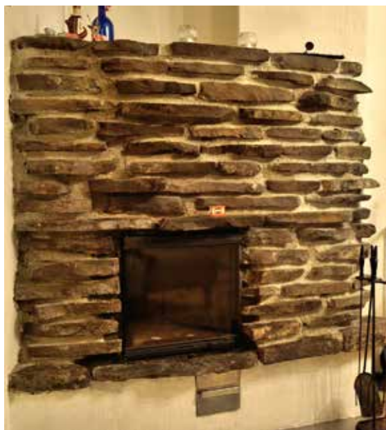
Takka entistä ehompana