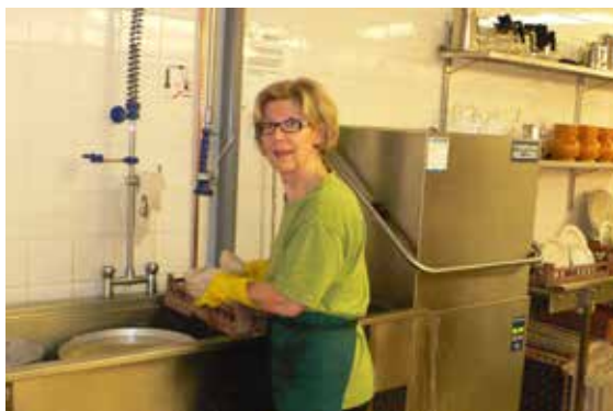
Tytti ja tiskikone, tehokas parivaljakko

Monta vuotta sitten tapasin muista yhteyksistä tutun rouvan työntelemässä tiskikärryjä Kiilopään ravintolassa. Ihmetykseeni hän vastasi olevansa Suomen Ladun jäsenenä siellä talkootöissä. Siitä jäi itämään ajatus ja kun jäin eläkkeelle, rupesin kyselemään mahdollisuuksia talkootyöhön.