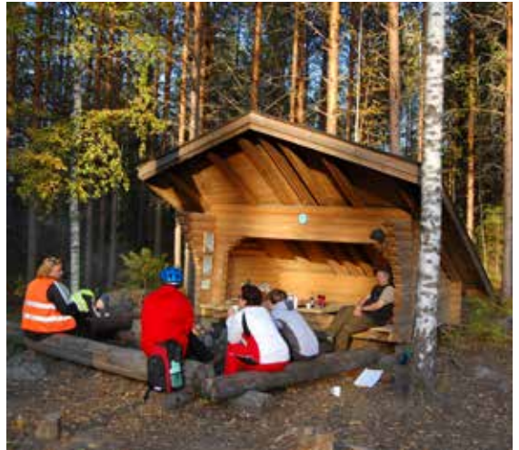
Hämmäauteensuon laavu Etelä-Karjalassa yleiseen käyttöön tarkoitettujen laavujen huollosta vastaavat usein seurakunnat, joiden jäsenet tekevät työtä talkoilla. Hämmäauteensuon laavu Lappeenrannassa.

mairittelevaa Etelä-Karjalan kannalta, mutta ammatillisilta voidaan ottaa oppia. Voimme kehittää Etelä-Karjalan retkeilypalveluja maakunnallisella yhteistyöllä. Paras asiantuntemus tilanteesta ja myös toiveista on aktiiviretkelijöillä, jotka ovat käyneet monissa eri kohteissa eri maakunnissa!