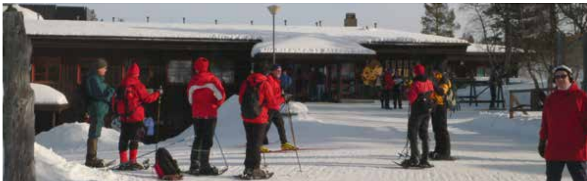
Päiväretki lumikengillä on starttaamassa Kiilopään pihasta.