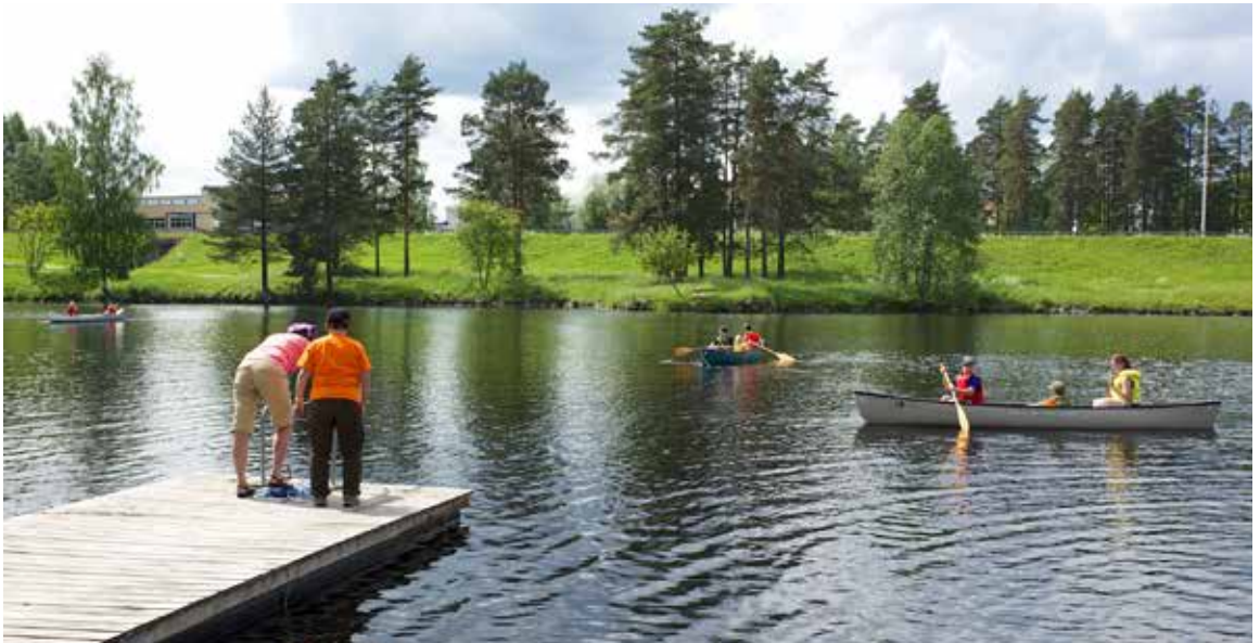
EKLUn leiriltä.

Lähes kaikkien toimikuntien työtä kohtaan osoitettiin kiinnostusta. Vetovoimaisimpina koettiin retki-, melonta- ja lapinmajatoimikunta. Myös mielenkiintoa nuorisotoimikunnan toiminnan aloittamiseen ilmeni kiittävästi.