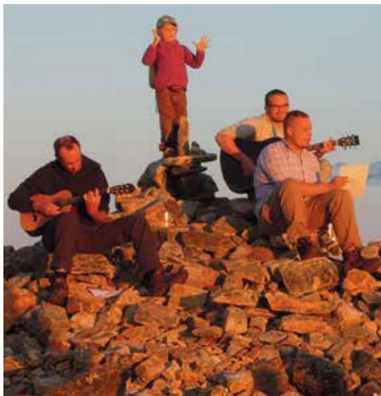
Kiilopään huipulla musisoitiin keskiyöhön asti.

Koko viikon ajan oli lämpötila helteen puolella lähemmäs +30 astetta, jopa ylikin. Tunturien tuuli kuitenkin helpotti oloamme. Hytysistä ja mäkäräisistä ei ollut haittaa, ainoastaan pienen pienet polttaiset tulivat il-