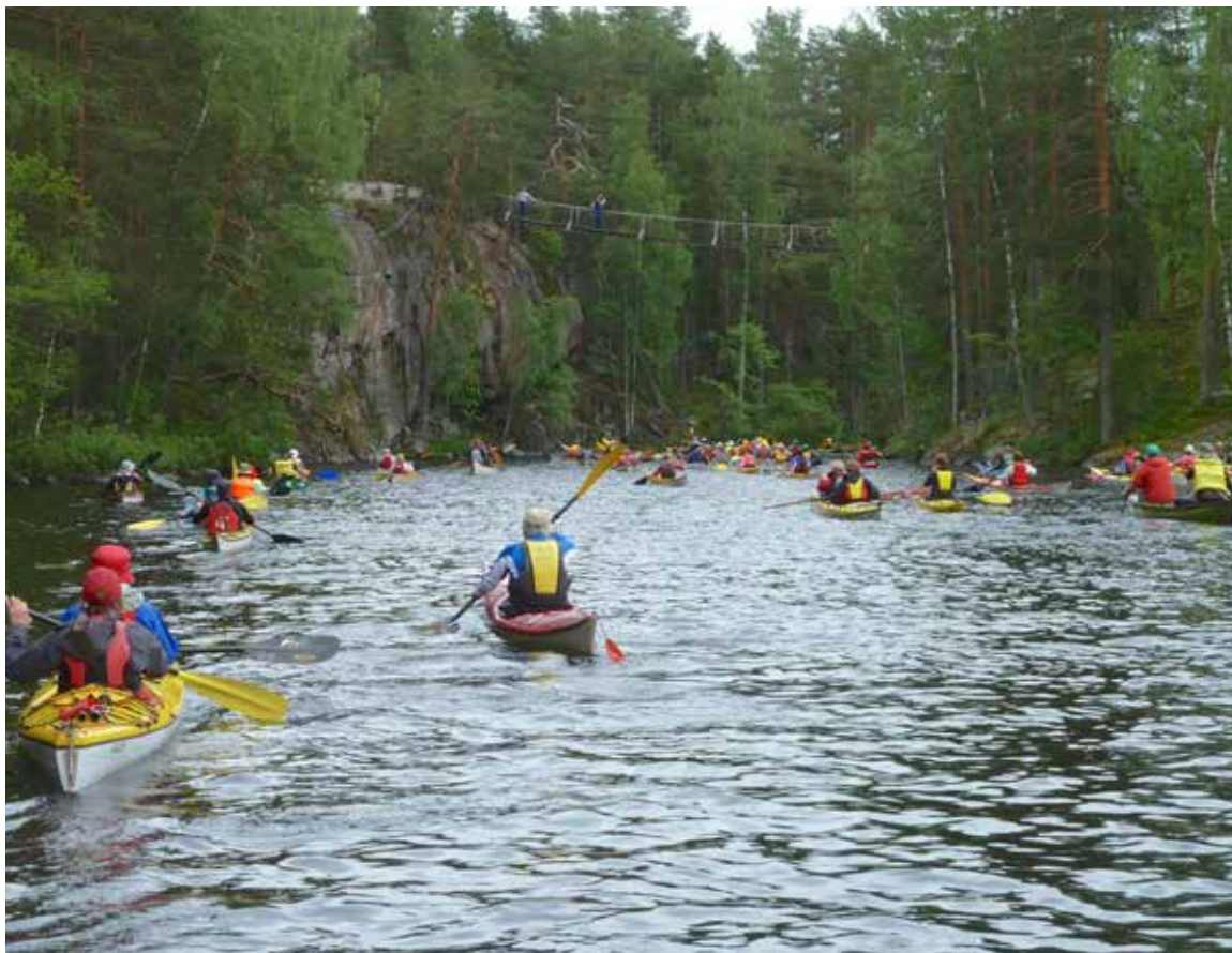
Repoveden kansallispuistoon.