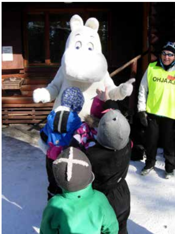
Muumien hiihtokoulussa

Totut tiedonvälityskanavat pitivät pintansa. Tietoa toiminnasta toivotaan edelleen saatavan perinteisillä tavoilla. Sähköpostitse saatu viesti tosin kiilasi mukaan tuttuun kolmikkoon. Seuraavana olivat yhdistyksen