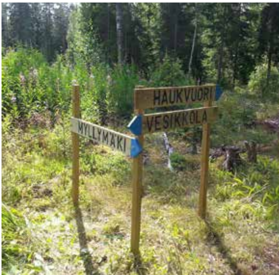
Joutsenon viitat Kesällä 2014 uusittiin retkeilyreittien viittoja koko maakunnassa. Joutsenon reiteillä yhteistyössä oli mukana Joutsenon Kullervo.

Paikalliset retkeilymahdollisuudet ovat tärkeitä asukkaiden virkistystä varten houkuttelemaan ja ohjaamaan luonnossa liikkujia, niin paikallisia kuin vierailijoitakin. Vertailu Metsähallituksen kohteisiin ei ole aina kovin