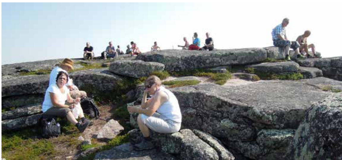
Tunturissa oli leppoisaa istuskella helteestä huolimatta.