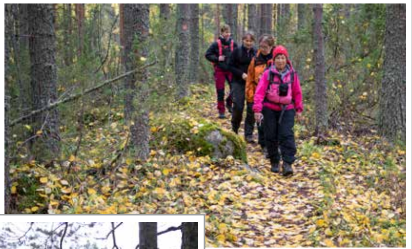
Syksyn lehdet peittävät retkeläisten polun