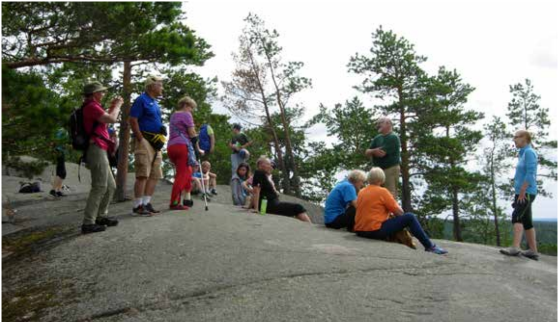
Latualueen kesätapahtumaan osallistujia ihailmassa litin Hiidenvuoren maisemia. Huipulle kipuaminen onnistui kyynänsauvojen kanssa.

. Ensilumen retki Kiilopäälle, Joulukuu 2018 . Alueryhmä varmistaa jäsenviikkojen ajankohdan ja varaa paikat. Valmistelu: Aluetyöryhmä.