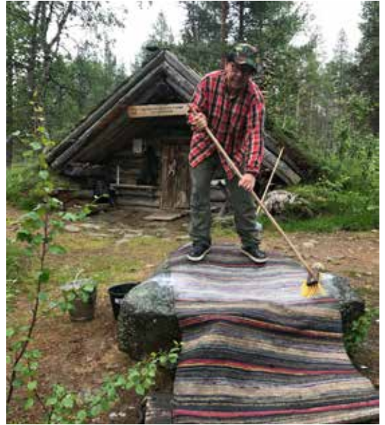
Perinteinen ruokapöytä toimi myös matonpesussa.