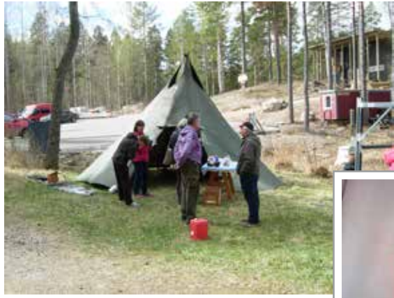
Veikon kota odotteli kävijöitä

Suomen Luonnon päivänä, 20.5. villiinnyttiin keväästä kanoottivajan rannassa. Ohjelmassa oli näyttely luonnonrysteistä, tietoa jokamiehen oikeuksista, pakuriteen ja nokkoskeiton maistiaisja sekä lasten luontopolku. Tapahtuma järjestettiin yhteistyössä Imatran seudun ympäristötoimen, Etelä – Karjalan Marttojen, Saimaan Ladun ja Imatran Lapinkävijöiden kesken.