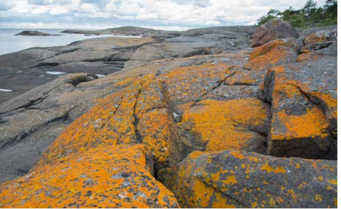
Itäisen Suomenlahden kansallispuistossa sijaitsevan Ulko - Tammion luonto koostuu lehtometsistä ja komeista kallioista.