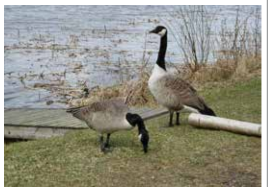
Luonnon asukkaita vieraili luontotapahtumassa