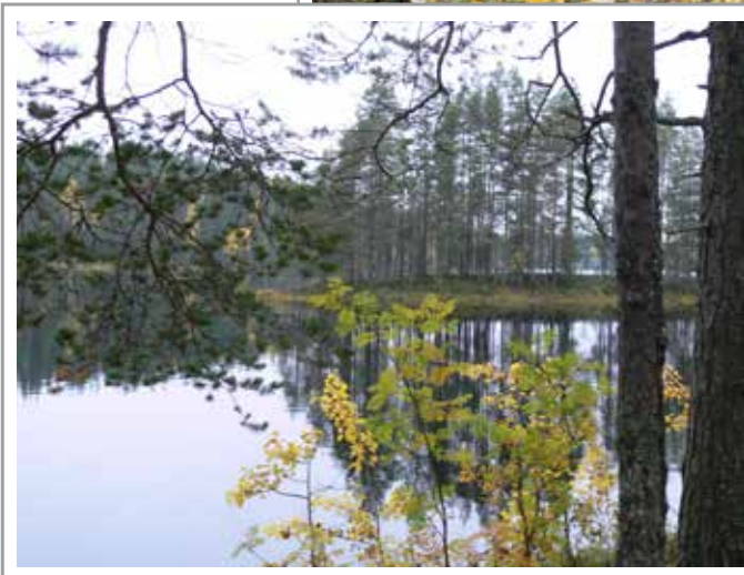
Kappale kaunista Petkeljärven luontoa