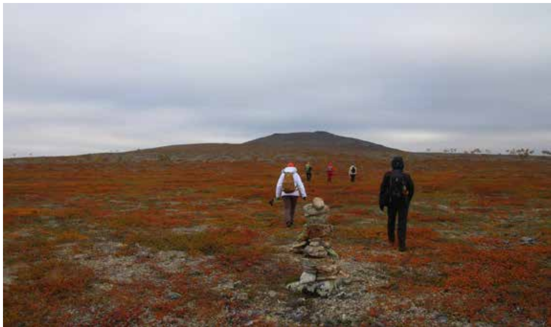
Retkiporukka sai nauttia ruskan loisteesta tunturiylängöllä matkalla Ahkovarrille.

Keskiviikkona tihusadetta, harmaata, välillä poutaa. Kaikki nousimme Akujoen vartta kohti Akuköngästä. Aivan Akuköngään alla joutuimme ylittämään Luovdejohtkan, mikä onnistui pitkävartisilla vaelluskengillä tai saappailla, mutta jotkut riisuivat kahlausta varten