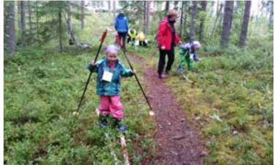
Ollinmajan olympialaisissa hiihdetään kesälläkin