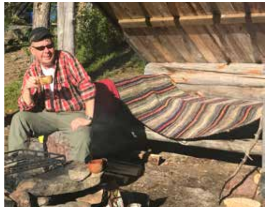
Loppupäivä meni mattoa kuivatella ja kahvitella.