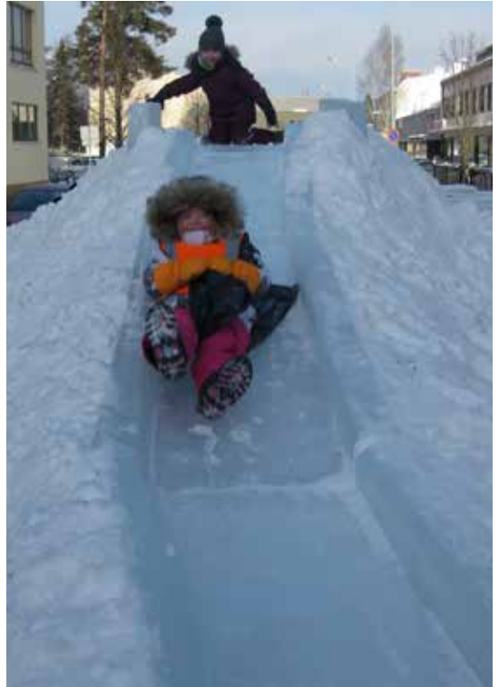
Valmista tuli, nyt kokeilemaan