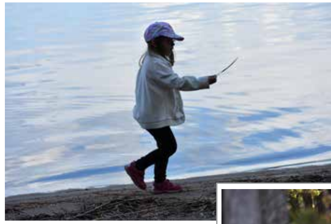
Iltahämärässä rannalla

Lapinkävijät osallistui Suomen Ladun valtakunnalliseen haasteeseen Nuku yö ulkona 17. -18. 6. Taipalsaaren Kyläniemessä sijaitsevalla Hepohiekalla yövyttiin yhdessä Etelä – Karjalan partiolaisten kanssa