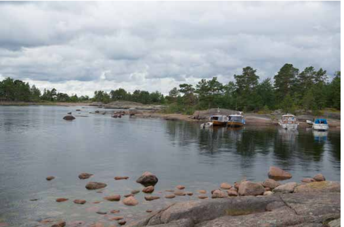
Saarelta löytyy retkeilijöille kaksi venesatamaa.