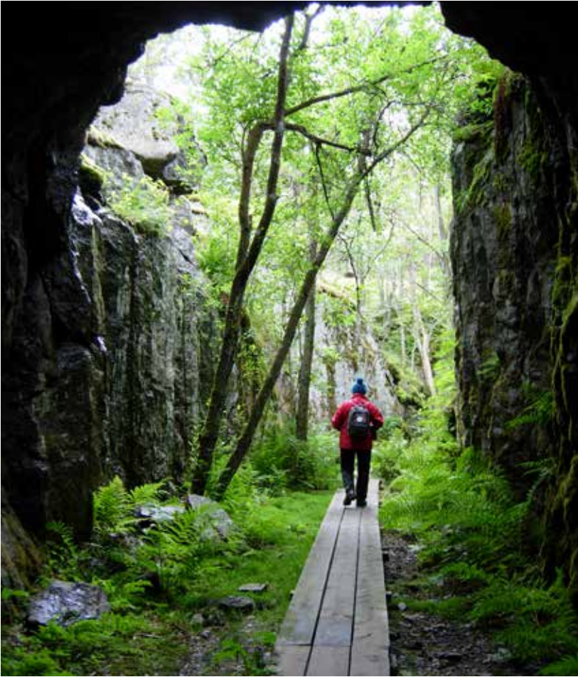
Saaren jatkosodan aikaisella Sotapolulla on tunneli, jonka suulta avautuu aivan eksoottinen näkymä.