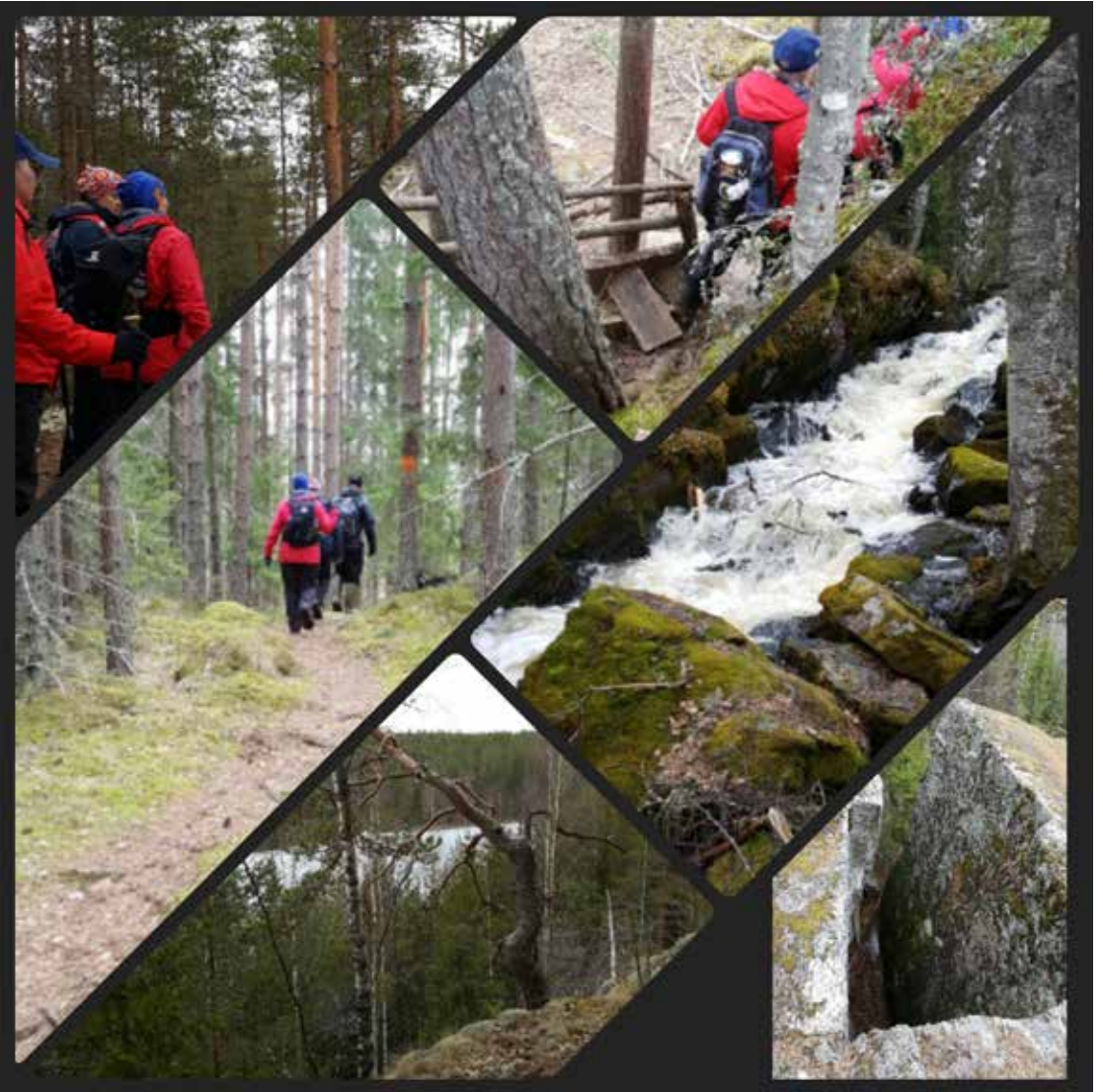
Kevätretki Myllykosken reitillä, Ruokolahdella Kuvakooste: Mirka Pietikäinen