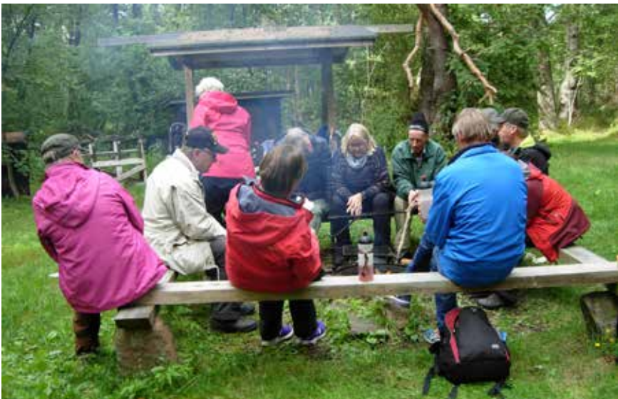
Myös Ulko – Tammiassa nuotion savut tulevat silmille.