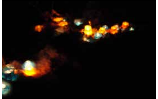
Joulupolulla kynttilät tuikkivat pimeässä metsässä