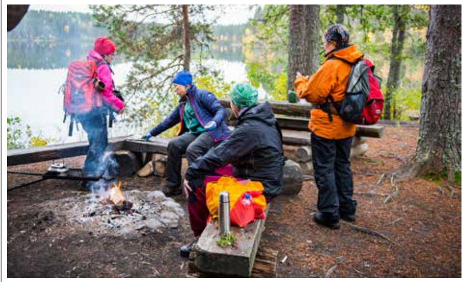
Evästäuolla tyynellä rannalla

Syksyllä retkeiltiin Ilomantsissa sijaitsevassa Petkeljärven kansallispuistossa.