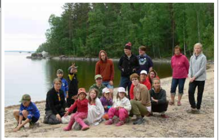
Yöpyjien ryhmä kuvassa