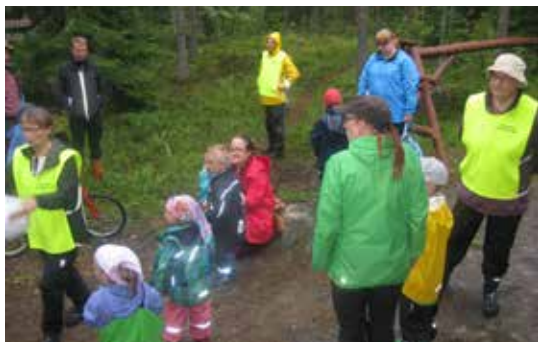
Palkintojen jaon tunnelmia