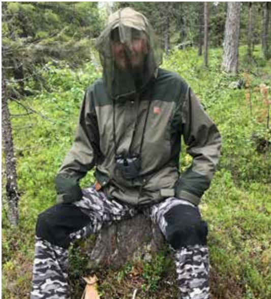
Itkoita oli riittävästi, mutta onneksi niihin oli varauduttu.

Aamulla leiri kasaan, maittava aamiainen ja matka jatkui kohti Kiilopäätä. Vaellussää oli mitä parhain, sopivan viileätä ja keli kuiva. Maasto oli tosin Suomujoen varressa sangen kosteata, Lappikin oli saanut osansa viime kesän sateista. Jotkut suon ylitykset olivat aika haastavia ja mätkähtihän allekirjoittanut kertaalleen mahalleen suolla, kun jalka tarrasi johonkin juurakkoon. Vahingot olivat onneksi lähinnä henkisiä. Sen verran kuitenkin joutui kättä paikkaamaan, että sai taas muistutuksen siitä, ettei asiallisen ensiapupakkauksen mukana kantaminen ole ollenkaan turhaa. Lankojärvellä lounastimme ja kuivattelimme suolla kastuneita vehkeitä. Tauon jälkeen talsimme vielä iltäkävelynä Rautulammelle, jossa laitoimme teltan lammen rantaan, söimme runsaan iltapalan, kun ei tarvinnut enää säästellä varamuonia