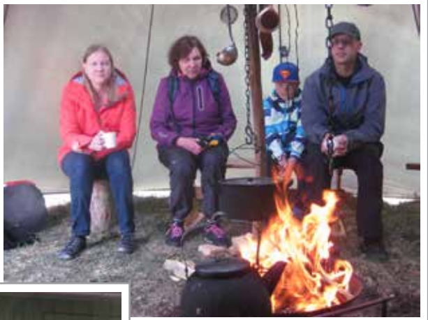
Tulilla on aina mukava istuskella liekkejä katselemassa.