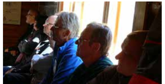
Tarkkaavaisia kuulijoita julkaisu-tilaisuudessa