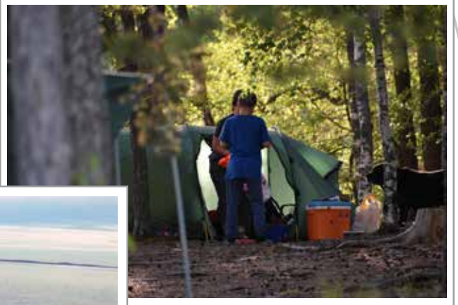
Teltta valmiina yöpymiseen