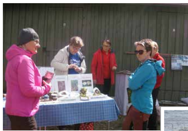
Villiyrtit kiinnostivat Marttojen pöydällä