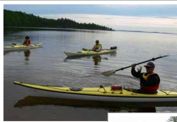
Melojat tulevat