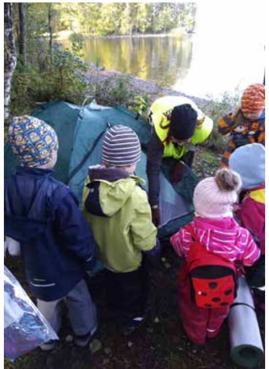
Teltan pystytys tehty