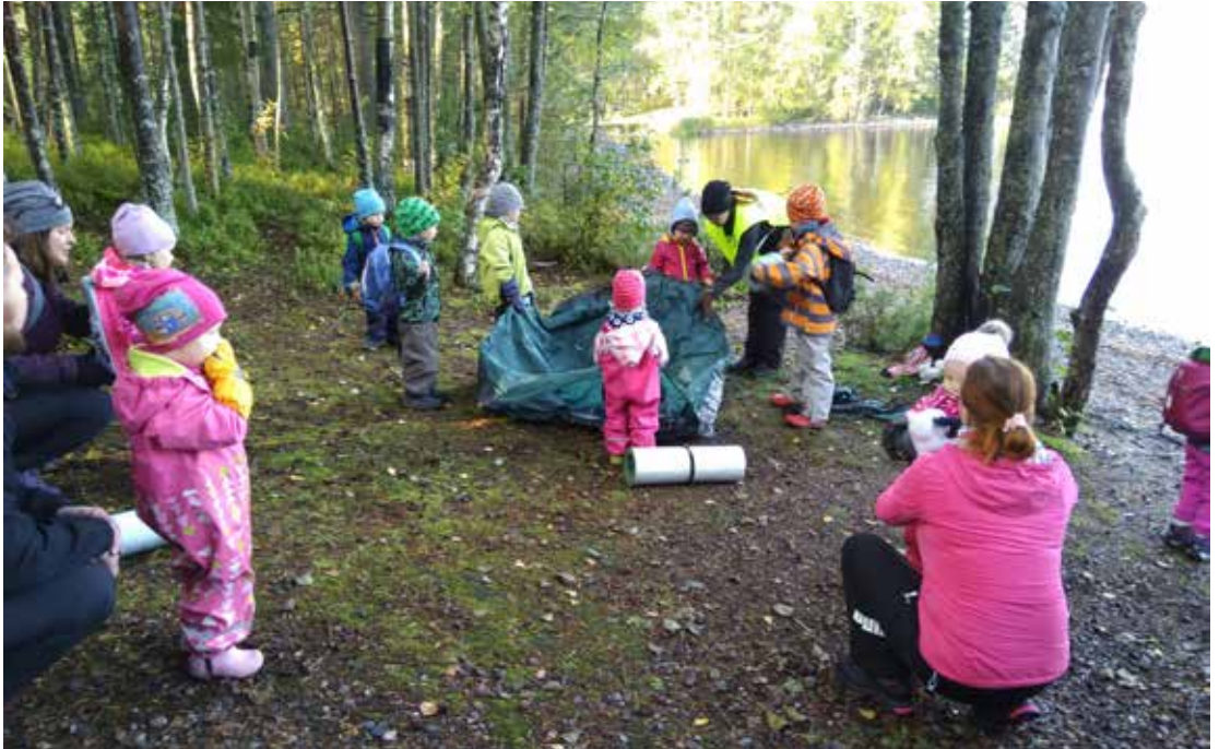
Teltan pystytystä opetellaan